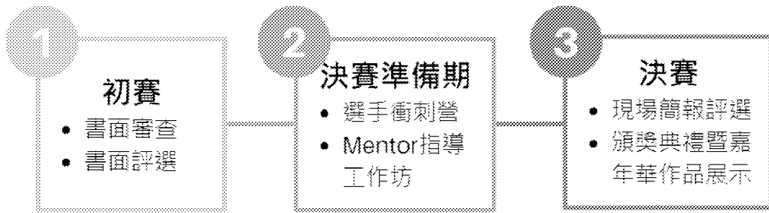
創客松競賽流程示意圖