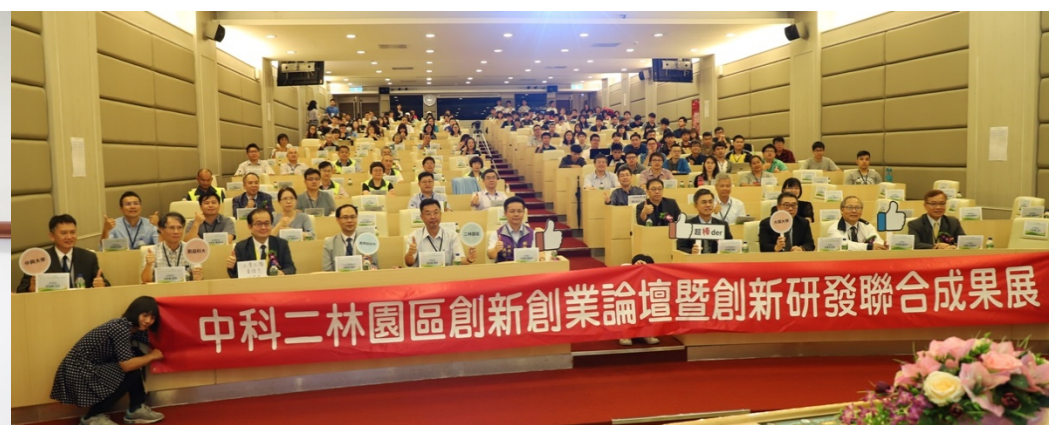
↑ 中科二林園區創新創業論壇暨創新研發聯合成果展