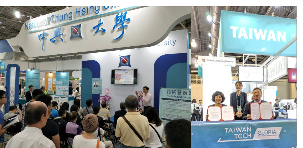
↑ BIO ASIA 2019 亞洲生技大展中興大學攤位