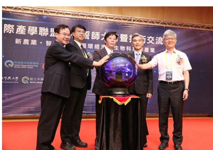
↑ 108年5月22日國際產學聯盟學校誓師大會暨技術交流會