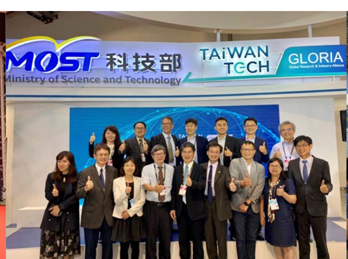
↑ 2019 COMPUTEX活動 科技部陳良基部長(左五)訪視國際產學聯盟攤位