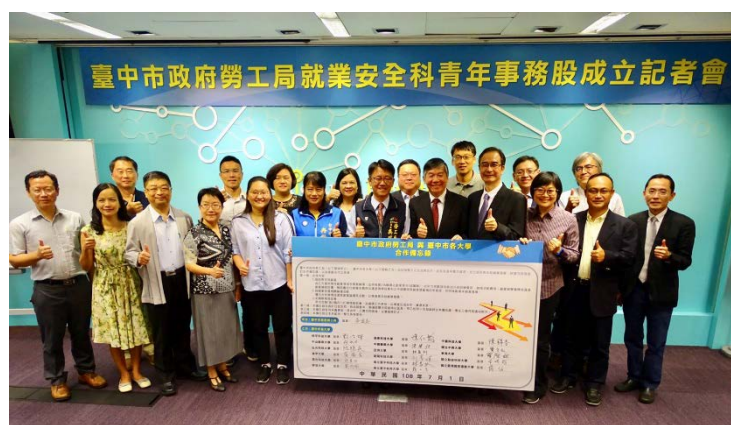
↑ 台中市政府成立「青年事務股」與17所大學簽署合作備忘錄