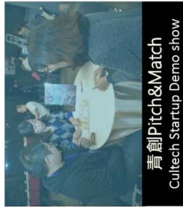
青創Pitch&Match Cultech Startup Demo show